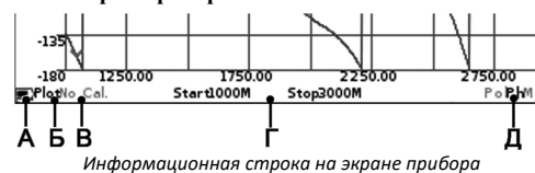
Информационная строка на экране прибора

На экран прибора выводятся результаты сканирования частотного задания в виде установленных пользователем графиков и диаграмм. Текущие настройки прибора, диапазон сканирования, тип выводимого графика или диаграммы и другая важная для пользователя информация расположена на нижней строке экрана. Рассмотрим эту информационную строку слева направо.